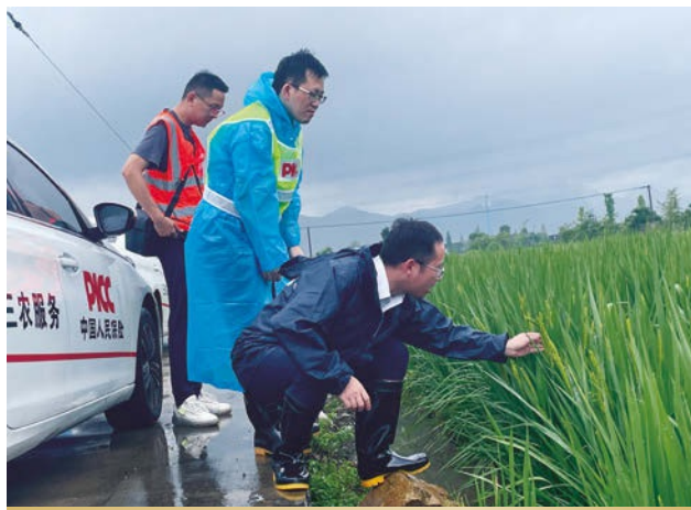
人保財險服務「梅花」颱風救災理賠

受人傷賠償標準上漲以及歷史業務賠付責任的影響，責任險整體賠付率76.2%，同比上升8.3個百分點；同時，人保財險加強客戶群分類管理，強化渠道管理，精準配置資源，責任險費用率36.6%，同比下降2.9個百分點；綜合成本率112.8%，同比上升5.4個百分點。