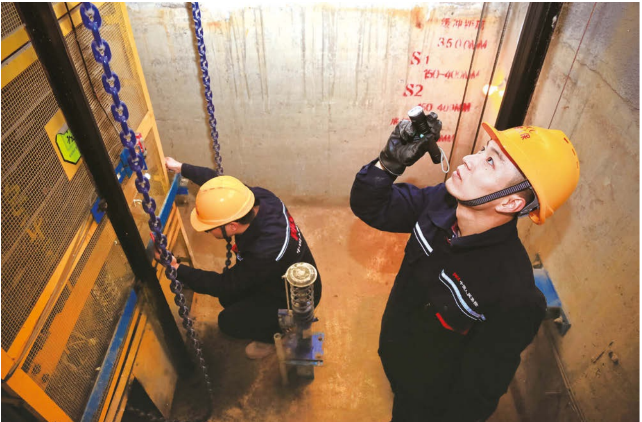
人保財險定期對電梯進行全面「體檢」和監測

人保財險深入服務社會治理，護航大國重器，持續加大產品創新和推廣力度，其他險實現總保費收入148.64億元，同比增長5.4%。