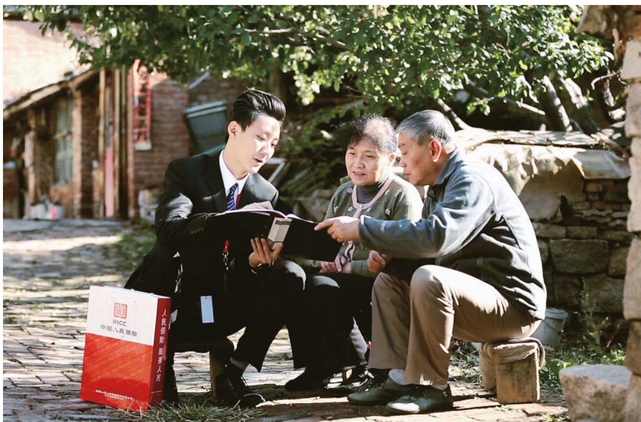
人保壽險為農村地區居民打造「親民保」惠民人身險產品