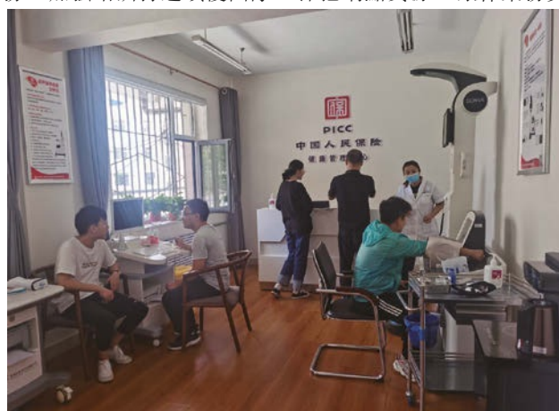
人保健康舉辦客戶健康體驗專場活動

按規模保費統計，2022年，個人保險渠道、銀行保險渠道、團體保險渠道分別實現規模保費187.15億元、86.54億元、138.96億元。