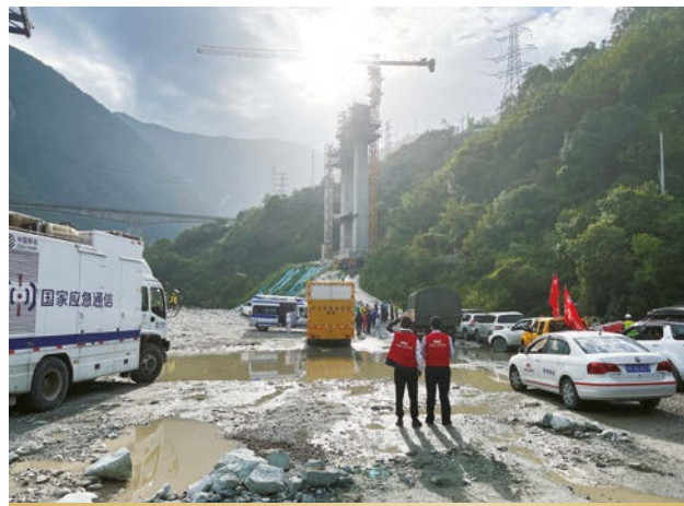
人保財險迅速應對四川甘孜州瀘定縣6.8級地震